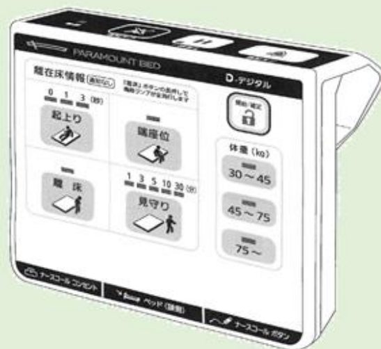
【ベッド内蔵型センサー】