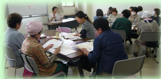
相談窓口とパンフレットの紹介

今回、紹介した「重要な面談にのぞまれる患者さんとご家族へ」のパンフレットは、医療者とのコミュニケーションに活用できるようになっています。添付しますので、みなさまもごらんください。いつでも患者さんが気軽に相談できるよう、医療者からのやさしい声かけが患者さんにとって一番の安心につながっていると感じています。