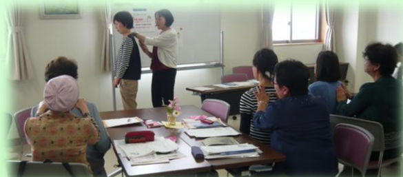
川柳で大笑いし、マッサージでリラクゼーション