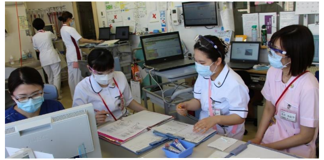
（排尿ラウンドの様子）

排尿に関する悩みはとてもデリケートな問題です。「仕方が無い」や「そういうものだ」とあきらめ相談できない患者さんも多くいらっしゃいます。そういった患者さんのQOLの向上に繋がっていきたいと考えています。