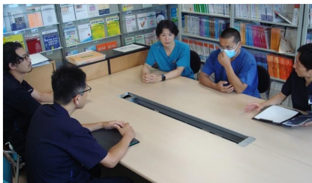
(カンファレンスの様子)

もう一つの目的は、関節外科治療に対する専門性をより高めることです。近年の関節外科の進歩はめざましいものがあり、これまでの治療で成果があまり認められなかった手技や手法が実は成績が良かったなど新たな事実が多々明らかとなっています。新しくわかってきたエビデンスに基づいてより専門性のある治療を提供できるように専任のスタッフで治療に臨むことが必要です。私たち自身も日々研鑽を積み、湖北地方の皆様安心して最先端のチーム医療を提供できるよう頑張ります。