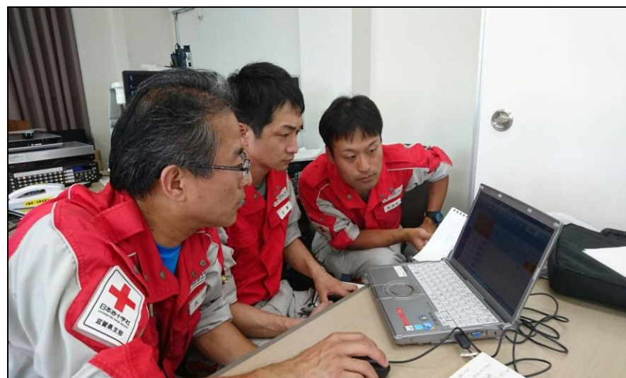
三島救命センターでのEMIS入力作業