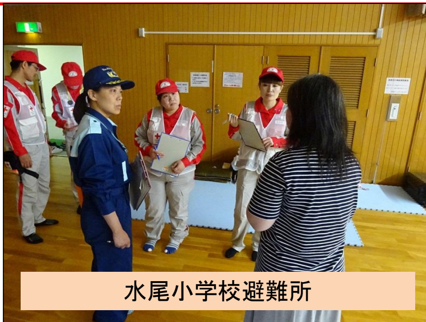
水尾小学校避難所