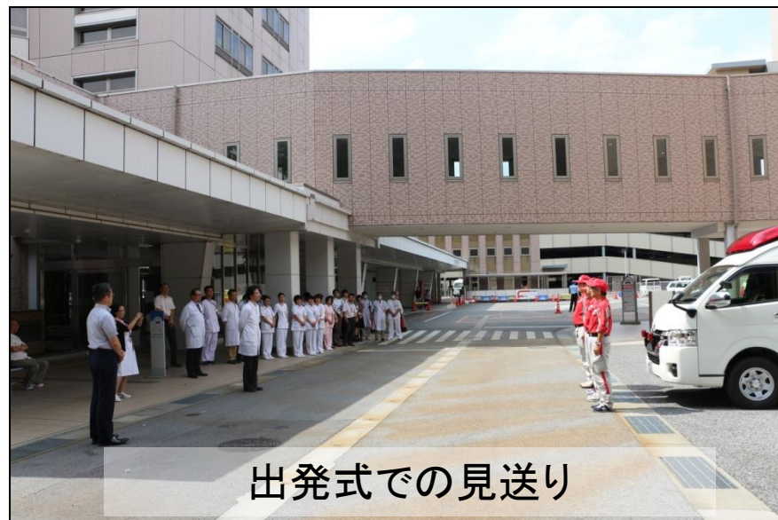
出発式での見送り