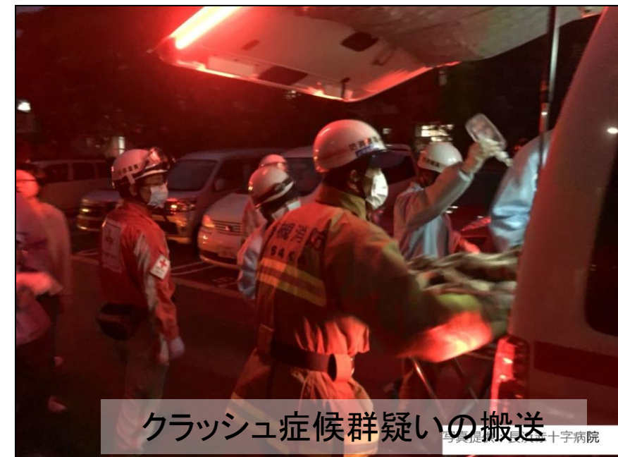
クラッシュ症候群疑いの搬送 長浜赤十字病院