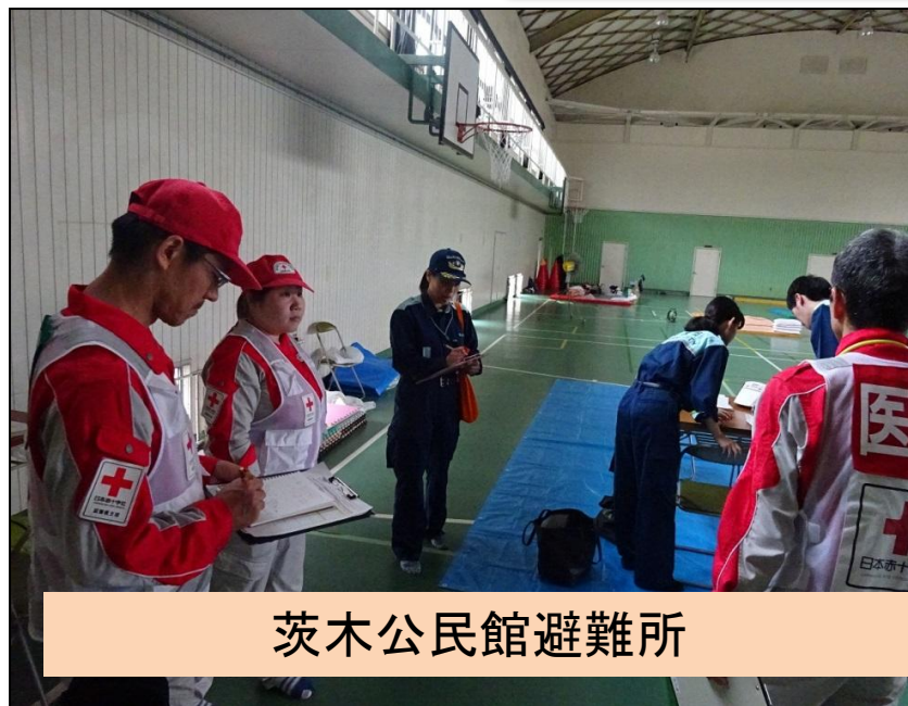
茨木公民館避難所