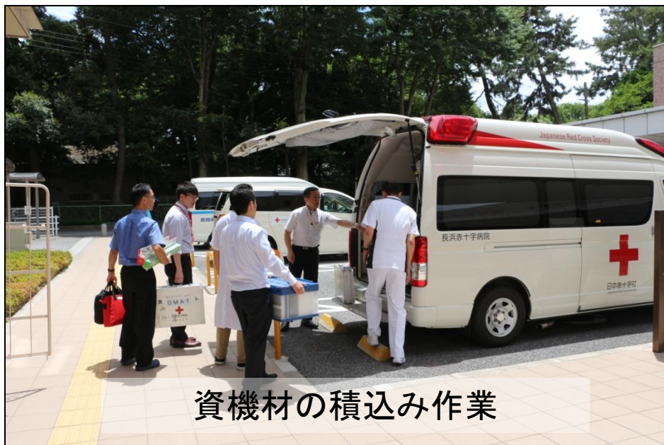
資機材の積み込み作業